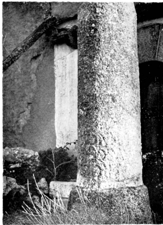
FIGURA 4. Miliario CLIIX, en posición invertida, mostrando una parte de la inscripción.