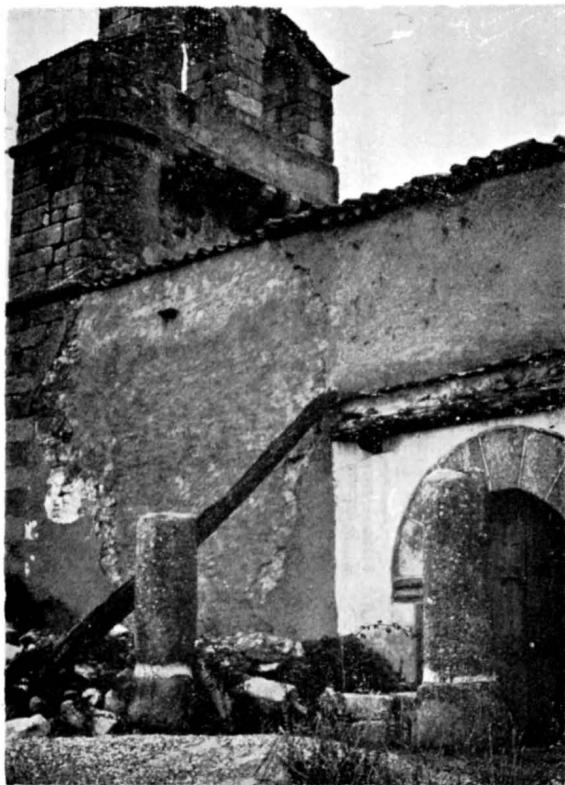
FIGURA 3. Emplazamiento actual del miliario CLIIX (derecha de la fotografía), junto con otro anepígrafo, frente a la antigua Iglesia Parroquial de Membribe de la Sierra. Obsérvese el cerquillo de cal con que están fijados a sendas basas, también de granito, y de mayor diámetro que los miliarios.