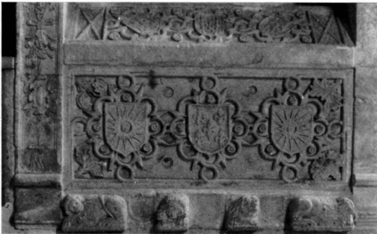
Sepulcro de D. Pedro de Solís e Inés de Loarte